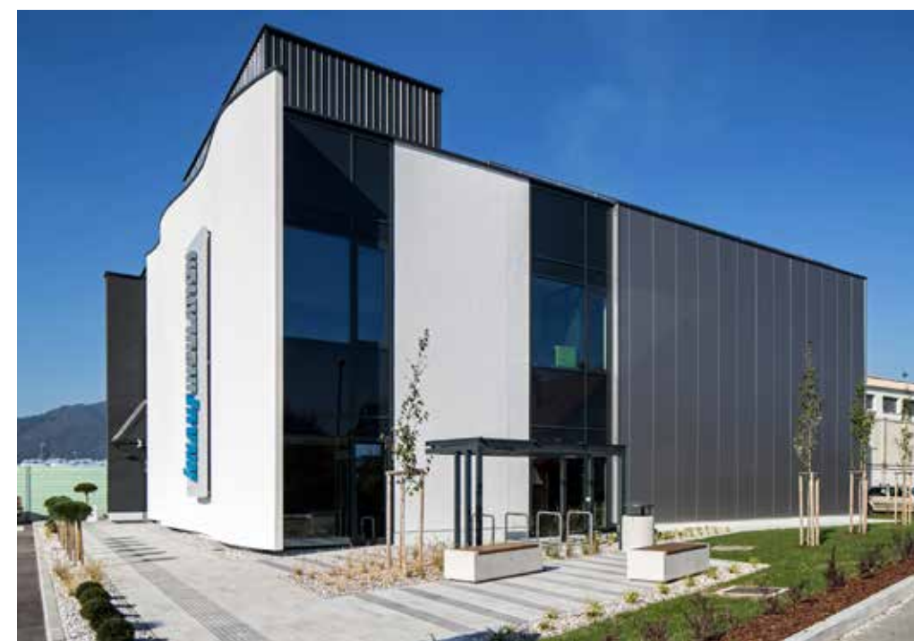
Experience center